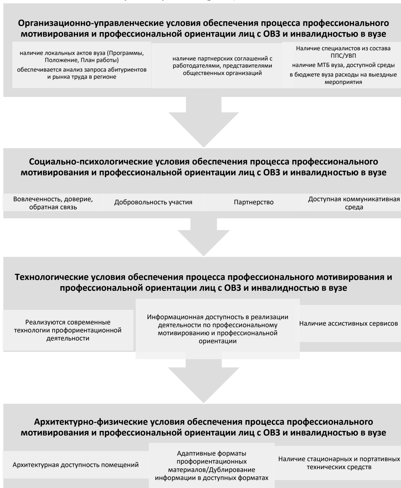
Рисунок 2 – Условия организации и реализации профориентационной работы

При организации профориентационной работы Организацией обеспечиваются следующие условия (рис.2).